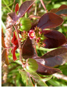
Figura 6. Pinhão-roxo