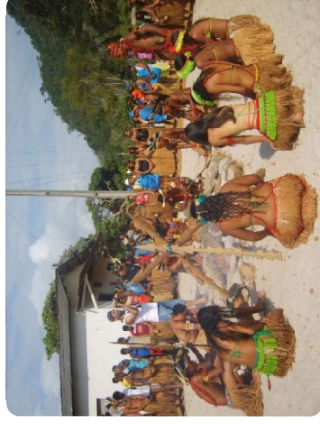
Figura 3. Momento religioso na aldeia Tupi-nambá da Serra do Padeiro, Buerarema-BA

mais uma vez, o ecogenocídio, a subalternização, a banalização e a falta de respeito à diversidade dos povos afro-indígenas na sua mais profunda compreensão.