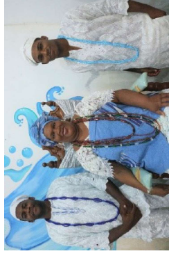
Ilê Asê Omin Lessyrê, 2021.