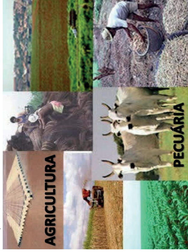
Figura 1. Exemplo de slide

➔ Slides Agricultura e Pecuária – https://www.slideshare.net/professor1ronaldo/slide-geografia-agricultura-e-pecuaria