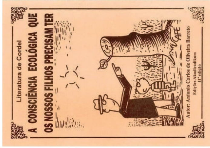
Figura 1. Capa de cordel

popular medieval da cultura portuguesa que se desenvolveu no Brasil. A capa de cordel apresentada a seguir foi publicada no site disponível em barretocordel.wordpress.com . Nela, percebemos alguns elementos que precisamos discutir. Vamos começar?