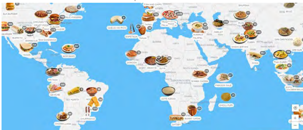
Picture 2. Pratos tradicionais distribuídos no mapa