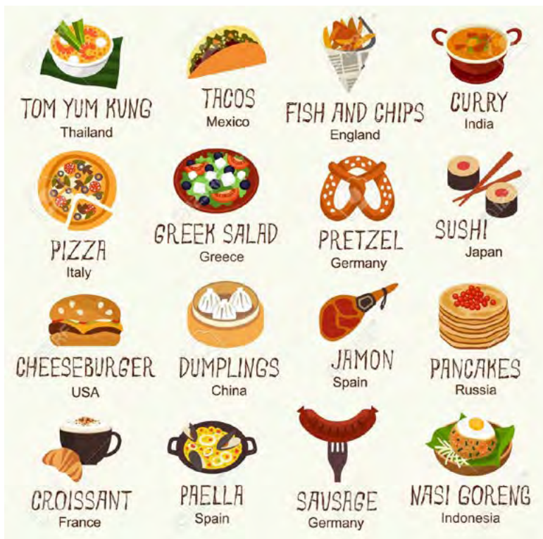
Picture 1. Famous food all over the world