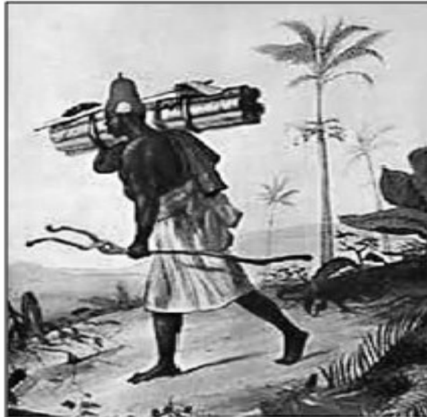
Jean Baptiste Debret. Negro de Origem Muçulmana. Viagem Pitoresca e Histórica ao Brasil.