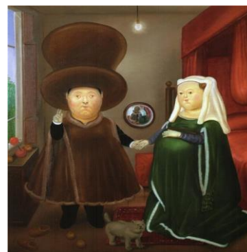
RELEITURA 1. Fernando Botero, After the Arnolfini Van Eyck, 1978

https://www.wikiart.org/pt/jan-van-eyck/o-casal-arnolfini-1434 . Acesso em 14 de maio 2020.