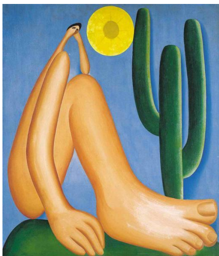
OBRA 2. Tarsila do Amaral, Abaporu, 1928.