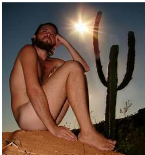
RELEITURA 2. Alexandre Mury. Imagem disponível em: http://www.hildegardangel.com.br/page/358/ . Acesso em 14 de maio 2020.

Imagem disponível em: https://www.wikiart.org/pt/tarsila-do-amaral/abaporu-1928 . Acesso em 14 de maio 2020.