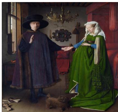
OBRA 1. Jan Van Eyck, O Casal Arnolfini, 1434